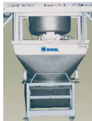
Báscula dosificadora con capacidad pesadora de 30 kg