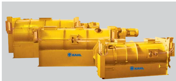
Mezclador de cargas