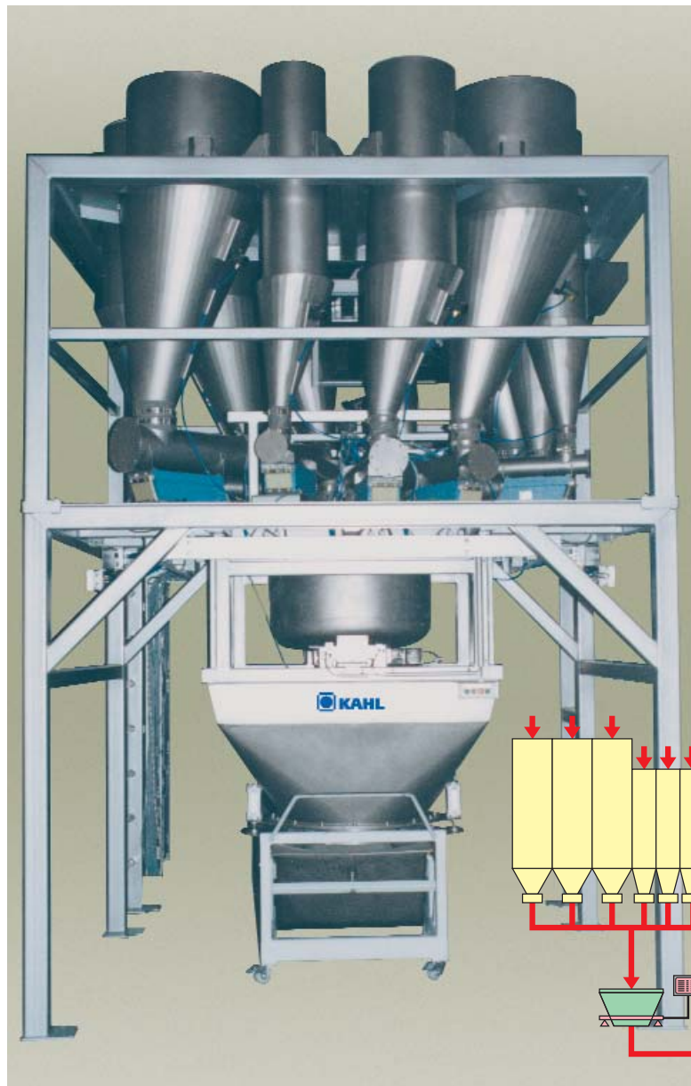
Planta dosificadora y pesadora de microcomponentes KAHL para 12 componentes con una báscula de 30 kg.

Las plantas dosificadoras, pesadoras y mezcladoras son utilizadas para la producción de premezclas y concentrados. Se pueden dosificar, pesar y mezclar pequeñas cantidades de componentes con alta precisión.