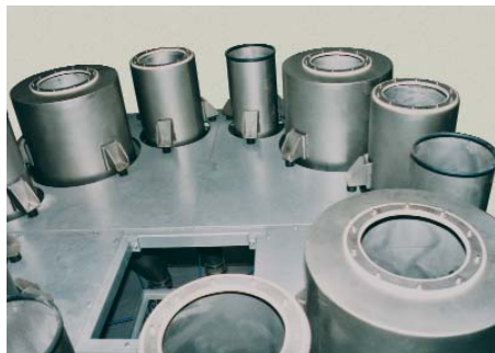
Depósito dosificador con 4 depósitos de 80 litros c.u., 4 depósitos de 160 litros c.u. y 4 depósitos de 360 litros c.u.