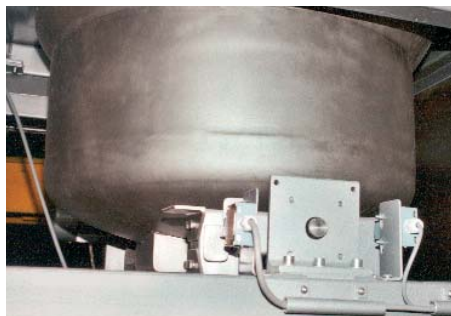
Depósito de pesaje de la báscula dosificadora